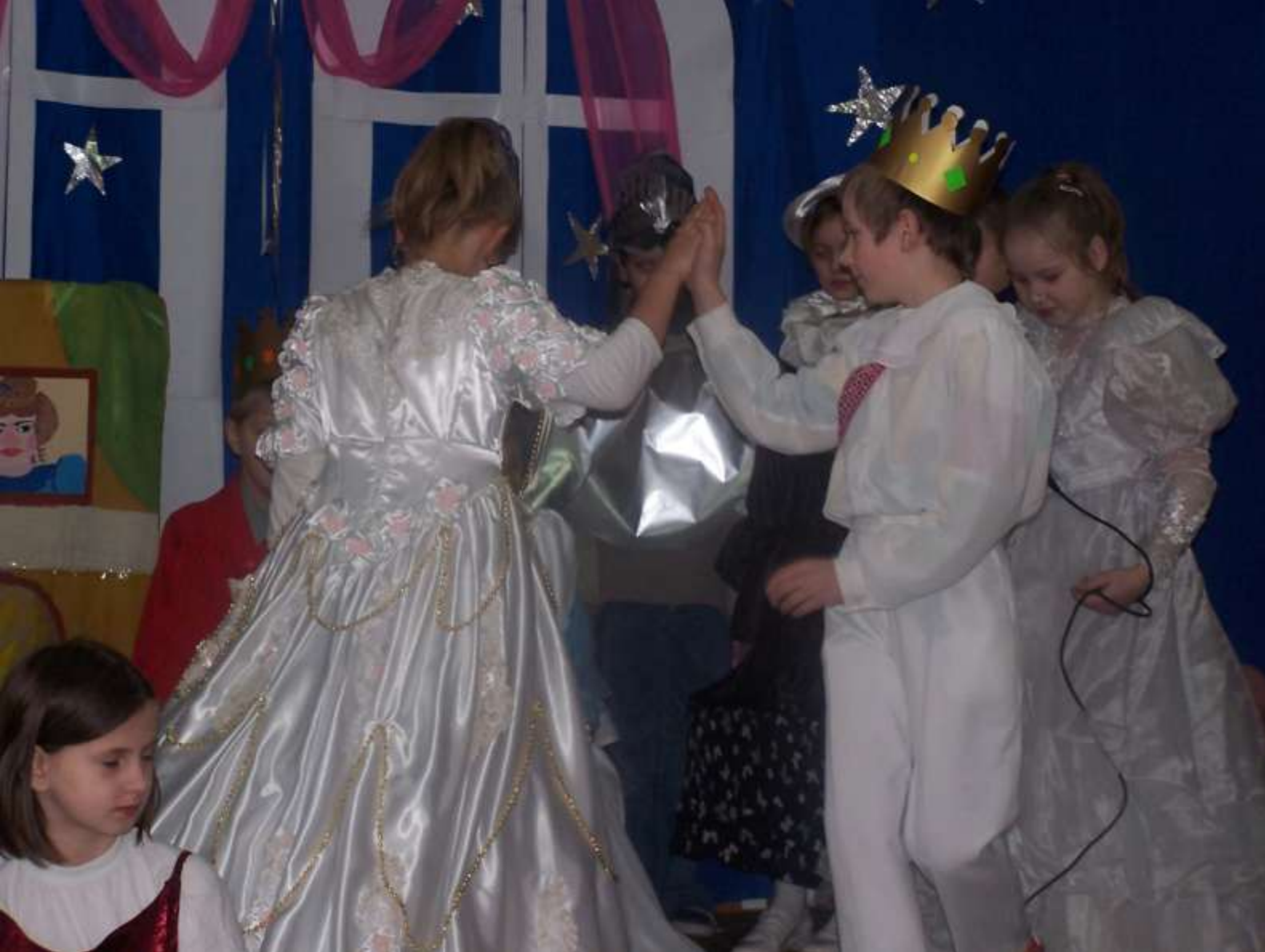
Kopciuszek na balu